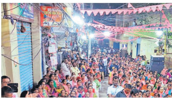
ప్రజా ఆశీర్వాదం సభకు హాజరైన ప్రజలు, బీఆర్ఎస్ శ్రేణులు

చేసిన మోసంతో తన రాజకీయ జీవితం ముగిసి పోయిందనుకున్న తరుణంలో ముఖ్యమంత్రి కేసీఆర్ తనను పిలిచి పార్టీలో చేర్చుకున్నారని, గ్రేటర్ హైదరాబాద్ వ్యాప్తంగా అన్ని నియోజకవర్గాల్లో పీజేఆర్ అభిమానులు ఉన్నారని... వారందరినీ కలిసి బీఆర్ఎస్ కు మద్దతు కూడగట్టాలని తనను ఆదేశించారని పేర్కొన్నారు. ఎట్టి పరిస్థితుల్లో ప్రజలు కాంగ్రెస్ పార్టీ నాయకుల మాటలు నమ్మవద్దని కోరారు. ఈ సందర్భంగా ఎమ్మెల్యే దానం నాగేందర్ మాట్లాడుతూ... పెద్ద ప్రజల సంక్షేమం