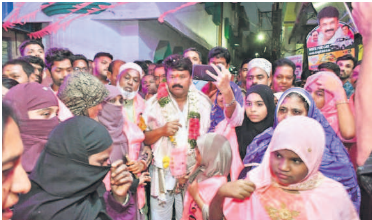
ముస్లిం బస్టిలో మంత్రి తలసాని శ్రీనివాస్ యాదవ్ కు ఘన స్వాగతం పలికిన మహిళలు

బన్సీలాల్పేట్, నవంబర్ 15: శీనన్నా మేమంతా మీ వెంటే, మూడోసారి కూడా మీదే గెలుపు అంటూ ముస్లిం మత పెద్దలు సనత్ నగర్ నియోజకవర్గ బీఆర్ఎస్ అభ్యర్థి, మంత్రి తలసాని శ్రీనివాస్ యాదవ్ ను ప్రచారంలో ఆశీర్వాదించారు. బుధవారం బన్సీలాల్పేట్ డివిజన్ లోని బండ్రమై సమ్మనగర్, మెట్లబావి, మసీదు గల్లీ, ట్రస్ట్ ఆఫీస్, ఏ.బీ.సీ క్లాస్, చాచానెహ్రాసగర్ ప్రాంతాల్లో ఇంటింటి ప్రచారం చేశారు. ప్రతి బస్టిలో ఆయనకు ఘన స్వాగతం లభించింది. అడుగుడుగునా ఆయనకు మహిళలు మంగళహారతులిచ్చి, విజయతిలకం దిద్దారు. ఈ సందర్భంగా మంత్రి మాట్లాడుతూ... తొమ్మిదేండ్లలో జరిగిన అభివృద్ధితో బన్సీలాల్పేట్ రూపురేఖలు మారిపోయాయిని, మరింత సేవ చేయడానికి భారీ మెజారిటీతో గెలిపించాలని కోరారు. డివిజన్ లోని ప్రతి బస్టిలో తాను అభివృద్ధి పనులు చేశానని, ఎల్లప్పుడూ ప్రజలకు అందుబాటులో ఉంటానని