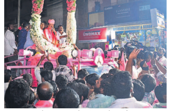
మూసాపేటలో బుధవారం జరిగిన రోడ్ షోలో ఎమ్మెల్యే కృష్ణారావుకు గజమాలతో స్వాగతం పలుకుతున్న కార్యకర్తలు