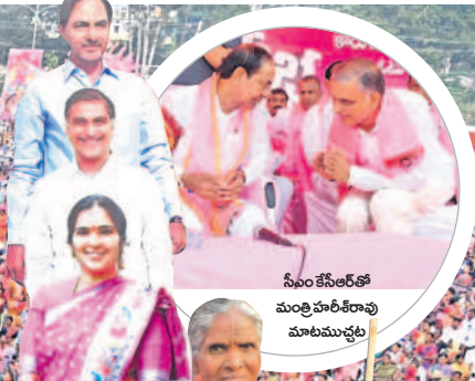
సీఎంకేసీఆర్ తో మంత్రి హాళీకేరావు మాటముచ్చట