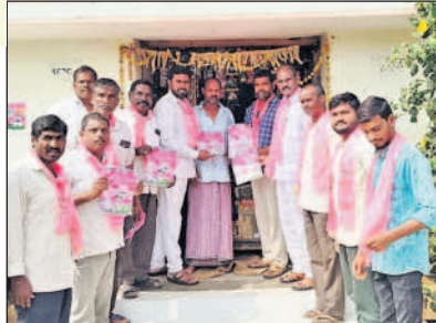
రామాయిపల్లిలో ప్రచారం చేస్తున్న నాయకులు