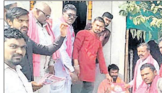
జైసూర్ లో ప్రచారం చేస్తున్న బీఆర్ఎస్ నాయకులు