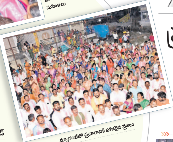
స్వాగంజీలో ప్రచారానికి హాజరైన ప్రజలు