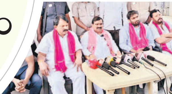
విలేకరుల సమావేశంలో మాట్లాడుతున్న మంత్రి పట్నం మహేందర్ రెడ్డి