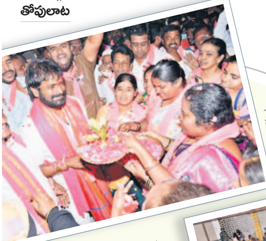
మంత్రి శ్రీనివాస్ గౌడ్ కు హాజరై పడుతున్న మహిళలు