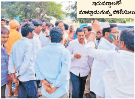
ఇరువర్గాలతో మాట్లాడుతున్న పోలీసులు