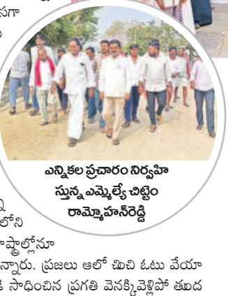
ఎన్నికల ప్రచారం నిర్వహిస్తున్న ఎమ్మెల్యే చిట్టెం రామ్మోహన్ రెడ్డి