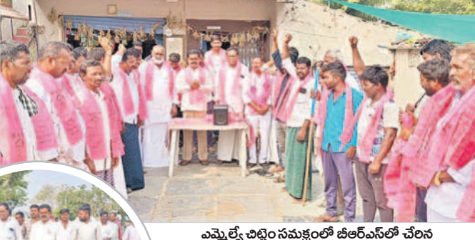
ఎమ్మెల్యే చిట్టెం సమక్షంలో బీఆర్ఎస్ లో చేరిన చిన్నగోపాపుర గ్రామస్తులు

కరెంటుతో తంటాలు పడుతున్నారని తెలిపారు. పంటలు ఎండి రైతులు రోడ్లపైకి వచ్చి రాస్తారో కోలు చేస్తుంటే ఒక్కడొచ్చి తెలంగాణ ప్రయత్నిస్తున్నట్లు వివరించారు. ఇప్పుడిప్పుడే తెలంగాణ ప్రజల జీవితాలు బాగుపడుతున్నాయని, మరో సారి మోసగాళ్లను నమ్మి నష్టపడుతున్నారని మునగవద్దని కోరారు. సీఎం కేసీఆర్ హయాంలోనే పదేండ్లలోనే అభివృద్ధి, సంక్షేమంలో తెలంగాణ దేశంలోనే నెంబర్ వన్ స్థాయికి చేరుకున్నదన్నారు. మన రాష్ట్రంలోని పథకాలు అతర ప రాష్ట్రాల్లోనూ అమలు కావడం లేదన్నారు. ప్రజలు ఆలోచించి ఓటు వేయాలని, లేదంటే కష్టపడి సాధించిన ప్రగతి వెనక్కివెళ్లిపోతూ