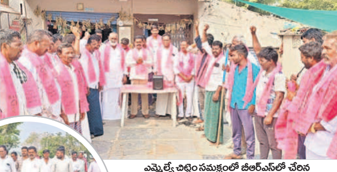
ఎమ్మెల్యే చిట్టెం సమక్షంలో బీఆర్ఎస్ లో చేరిన చిన్న గోష్టాపూర్ గ్రామస్తులు

కరెంటుతో తంటాలు పడుతున్నారని తెలిపారు. పంటలు ఎండి రైతులు రోడ్లపైకి వచ్చి రాస్తారో కోలు చేస్తుంటే ఒక్కడొచ్చి తెలం గాణ ప్రజలను మోసం చేసేందుకు ప్రయత్నిస్తున్నట్లు వివరించారు. ఇప్పుడిప్పుడే తెలంగాణ ప్రజల జీవితాలు బాగుపడుతున్నాయని, మరో సారి మోసగా క్లను నమ్మి నష్టపడు మునగవద్దని కోరారు. సీఎం కేసీ ఆర్ హయాం లోనే పదేండ్లలోనే అభివృద్ధి, సంక్షే మంలో తెలం గాణ దేశంలోనే నెంబర్ వన్ స్థాయికి చేరుకున్న దన్నారు. మన రాష్ట్రంలోని పథకాలు అతర ప రాష్ట్రాల్లోనూ అమలు కావడం లేదన్నారు. ప్రజలు ఆలో చించి ఓటు వేయా లని, లేదంటే కష్టపడి సాధించిన ప్రగతి వెనక్కివెళ్లిపో తుద