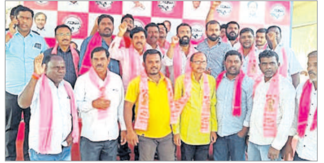
నిర్మల్ టౌన్ : గౌతంరెడ్డి అధ్యక్షులతో బీఆర్ఎస్లో చేరిన బోయవాడ కాలనీ వాసులు