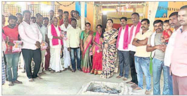
పెంజ : శేట్లపల్లిలో ఎన్నికల ప్రచారం చేస్తున్న నాయకులు