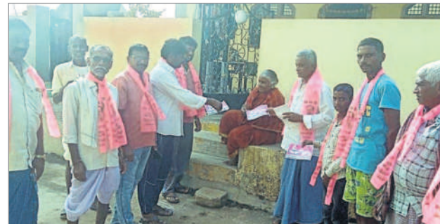
ఖానాపూర్ రూరల్ : కొత్తపేటలో ఎన్నికల ప్రచారంలో పాల్గొన్న బీఆర్ఎస్ నాయకులు