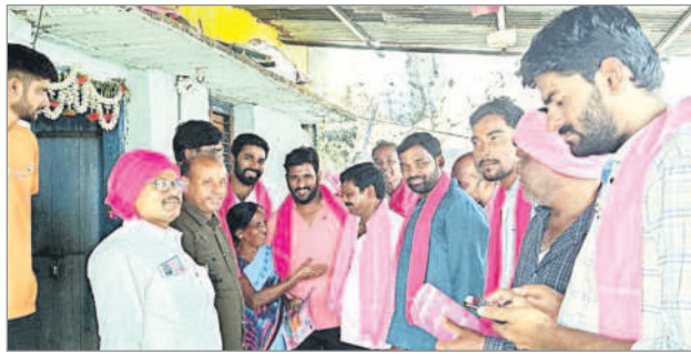
ఖానాపూర్ : పథకాలను ప్రజలకు వివరిస్తున్న నాయకులు