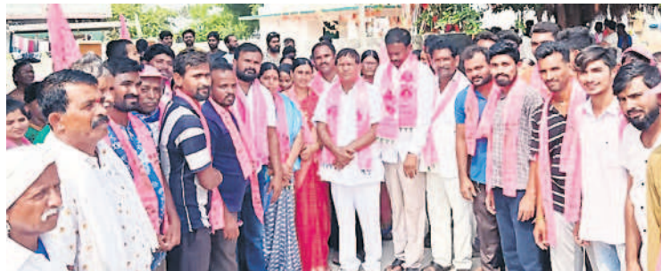
బీఆర్ఎస్లో చేరిన వారితో ఎమ్మెల్యే నల్లమాత భాస్కర్ రావు

దామరచర్ల, నవంబర్ 15 : మండలంలోని పలు తండాల్లో ప్రచారం నిర్వహిస్తున్న క్రమంలో కొత్తపేటతండాకు చెందిన 20 కుటుంబాలు,