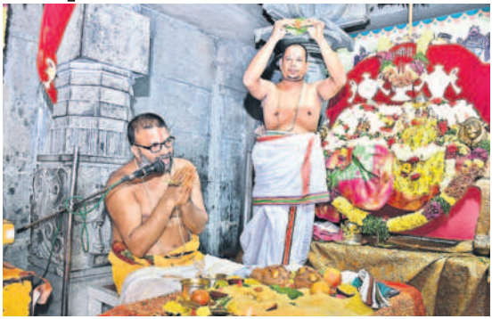
యాదగిరిగుట్టలో నిత్య తిరుకల్యాణోత్సవం నిర్వహిస్తున్న అర్చకులు

యాదగిరిగుట్ట, నవంబర్ 15 : యాదగిరిగుట్ట లక్ష్మీనరసింహ స్వామి ఆలయంలో కార్తీక మాసం సందర్భంగా ప్రతీ పూజల్లో భక్తులు పాల్గొని తరించారు. బుధవారం ప్రధానాలయంతోపాటు పూర్వ గిరి లక్ష్మీనరసింహ స్వామి ఆలయంలో కార్తీక మాస వేడుకలు విశేషంగా జరిగాయి. భక్తులు పెద్ద సంఖ్యలో పాల్గొని వేకువజామునే కొండపైన దీపాలు వెలిగించి మొక్కులు చెల్లించుకున్నారు. కొండ కింద సత్యనారాయణ స్వామి ప్రతీ మండపం సందడిగా మారింది. 152 మంది దంపతులు ప్రతీ మాచరించారు. ఆలయ ప్రాంగణంలో ఏర్పాటు చేసిన ప్రత్యేక మండపాల వద్ద మహిళలు భక్తిశ్రద్ధలతో దీపారాధన చేపట్టారు. తెల్లవారజామునే ఆలయాన్ని తెరిచిన అర్చకులు సుప్రభాతంతో స్వామివారిని మేల్కొలిపారు. అనంతరం తిరువారాధన జరిపి ఉదయం ఆర గింపు చేపట్టారు. ప్రధానాలయంలో స్వామి, అమ్మవార్లకు నిజాభిషేకం జరిపారు. స్వామివారికి తులసి సహస్రనామార్చన, అమ్మవారికి కుంకు మార్చన, ఆంజనేయస్వామికి సహస్రనామార్చన చేపట్టి భక్తులకు స్వామి, అమ్మవార్ల దర్శన భాగ్యం