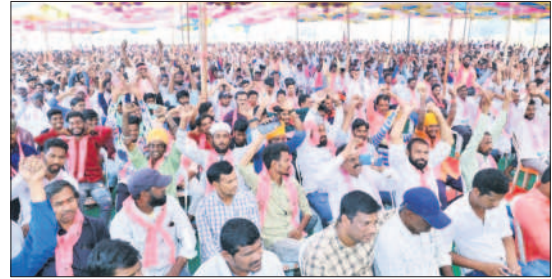
యువ ఆత్మీయ సమ్మేళనానికి తరలి వచ్చిన యువకులు