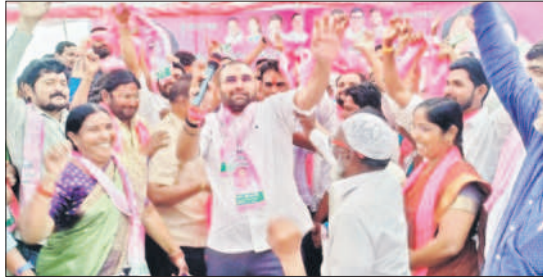
యువ ఆత్మీయ సమ్మేళనంలో నృత్యాల చేస్తున్న పోచారం బ్రదర్స్

యువ ఆత్మీయ సమ్మేళనానికి తరలిన యువకులు, నాయకులు బాన్సువాడ టౌన్/నరసరావుపేట, నవంబర్ 15 : బాన్సువాడ పట్టణం, బాన్సువాడ మండలం, బీర్పూర్, నరసరావుపేట మండలాల నుంచి బుధవారం సోమేశ్వర్ గ్రామ శివారులో నిర్వహించిన యువ ఆత్మీయ సమ్మేళనానికి యువకులు, నాయకులు ఖైక్ ర్యాల్కీగా తరలి వెళ్లారు.