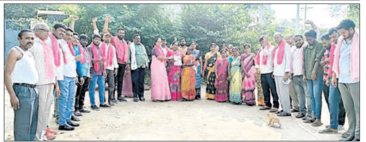
ప్రచారం చేస్తున్న నాయకులు

డెలివరీ గడువులోగా పూర్తి చేయాలన్నారు. రైస్ మిల్లులు పూర్తి సామర్థ్యం మేర నిర్వహించి, రైస్ ఉత్పత్తిలో వేగం పెంచి లక్ష్యం మేరకు సీఎంఆర్ రైస్ డెలివరీ చేయాలని, నిర్దేశిత సమయంలో లక్ష్యాలు చేరుకోని రైస్ మిల్లులపై చర్యలు తీసుకుంటామని స్పష్టం చేశారు. వాన కాలం పంటకు సంబంధించిన పెండింగ్ ఉన్న సీఎంఆర్ డెలివరీ దిశగా అవసరమైన చర్యలు తీసుకోవాలని ఆదేశించారు. వానకాలం 2023-24 ధాన్యం కొనుగోలు సమయం లో రైస్ మిల్లర్లు ఎలాంటి తరుగు లేకుండా ధాన్యం దించుకోవాలని, నాణ్యత పేరుతో ఎటువంటి కోతలు విధించవద్దని సూచించారు.