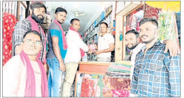
పెద్దపల్లి : ప్రచారం చేస్తున్న నాయకులు