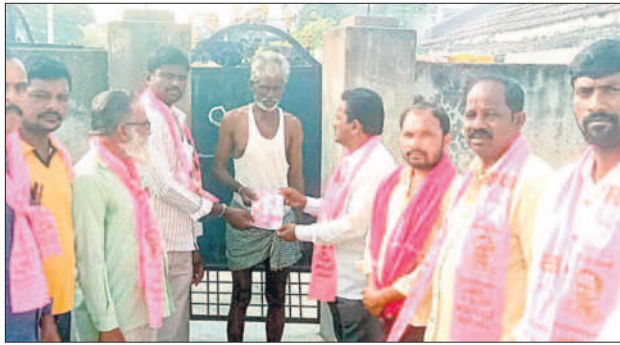
కాల్వశ్రీరాంపూర్ : కరవత్రాలు అందజేస్తున్న బీఆర్ఎస్ నాయకులు