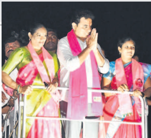
తంగళ్లపల్లిలో నిర్వహించిన రోడ్ షోకి హాజరైన కార్యకర్తలకు నమస్కరిస్తున్న మంత్రి కేటీఆర్, పక్కన ఎంపీపీ మానస, జడ్పీటీసీ మంజుల