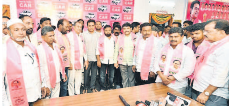
మంత్రి కేటీఆర్ సమక్షంలో బీఆర్ఎస్ లో చేరిన కామారెడ్డి నాయకులు