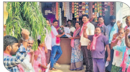
పంజుగులలో ప్రచారం నిర్వహిస్తున్న బీఆర్ఎస్ నాయకులు