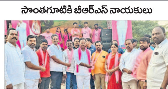
సాంతగూటికి బీఆర్ఎస్ నాయకులు