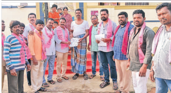
కల్వకుర్తి మున్సిపాలిటీ 21వ వార్డులో ప్రచారం నిర్వహిస్తున్న కౌన్సిలర్ సైదులు, బీఆర్ఎస్ నాయకులు