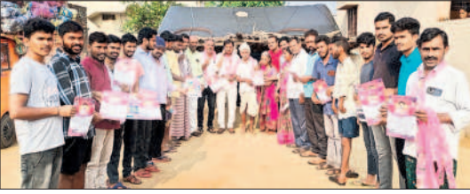
ధరావత్ తండాలో ప్రచారం చేపట్టిన బీఆర్ఎస్ శ్రేణులు