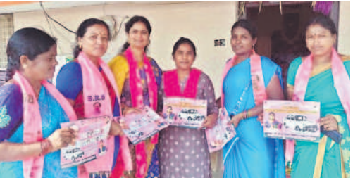
అత్తుకూరు(ఎం)లో కారుగుర్తుకు ఓటు వేయాలని అభ్యర్థిస్తున్న బీఆర్ఎస్ మహిళా నాయకులు