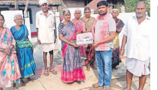
ఆలేరు రూరల్ : రాఘవాపురంలో ప్రచారం నిర్వహిస్తున్న బీఆర్ఎస్ వీ రాష్ట్ర నాయకుడు సంతోష్