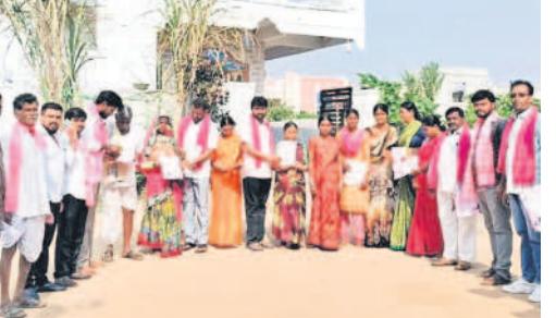
తుర్కపల్లి : జేఐరాంకండాలో ప్రచారంలో పాల్గొన్న జడ్పీ వైస్ చైర్మన్ బీకునాయక్