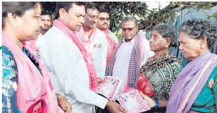
కరకగూడెంలో ఓటర్లకు ప్రభుత్వ పథకాలను వివరిస్తూ ప్రచారం నిర్వహిస్తున్న విప్ రేగా