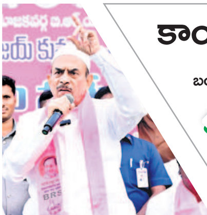
మాట్లాడుతున్న హోంమంత్రి మహమూద్ అలీ