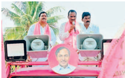
మాట్లాడుతున్న ఎమ్మెల్యే అభ్యర్థి వనమా