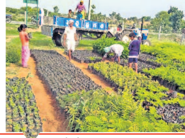
సర్కారిల్లో 301 కోట్ల మొక్కల పంపణానికి రూ.1,658 కోట్లు