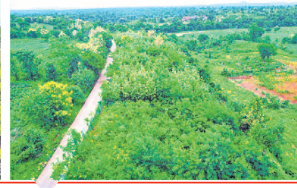
19,742 పల్లె ప్రకృతి వనాల ఏర్పాటుకు రూ.238 కోట్లు