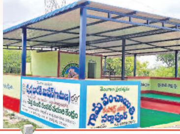
12,753 డంపింగ్ యార్డుల నిర్మాణానికి రూ.279 కోట్లు