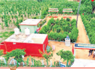
12,745 గ్రామాల్లో వైకుంఠ ధామాలకు రూ.1,532 కోట్లు