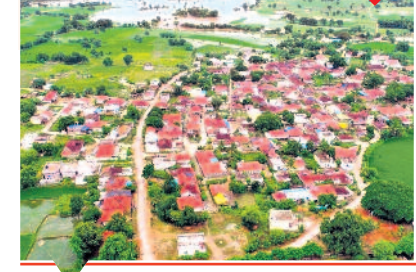
12,769 గ్రామాలకు ట్రాక్టర్ కోసం రూ.1,276.90 కోట్లు

గ్రామాలు, అనుబంధ అవాస ప్రాంతాల్లో మొత్తం 19,472 పల్లె ప్రకృతి వనాలను 13,657 ఎకరాల్లో ఏర్పాటు చేశారు. వీటిల్లో 2.12 కోట్ల మొక్కలను నాటారు. మండలానికి ఐదు చొప్పున ఇప్పటి వరకు 2,468 బృహత్ పల్లె ప్రకృతి వనాల (బీపీపీ) కోసం స్థలాలను గుర్తించారు. ఒక్కో బీపీపీని 10 ఎకరాల స్థలంలో ఏర్పాటు చేసి, 1,988 బీపీపీల్లో 1.87 కోట్ల మొక్కలను నాటారు. 19,472 ట్రీడా ప్రాంగణాలను ఏర్పాటు చేయాలనేది లక్ష్యం కాగా, 15,330 స్థలాలను గుర్తించారు. 13,720 ట్రీడా ప్రాంగణాల ఏర్పాటు పూర్తయ్యాయి.