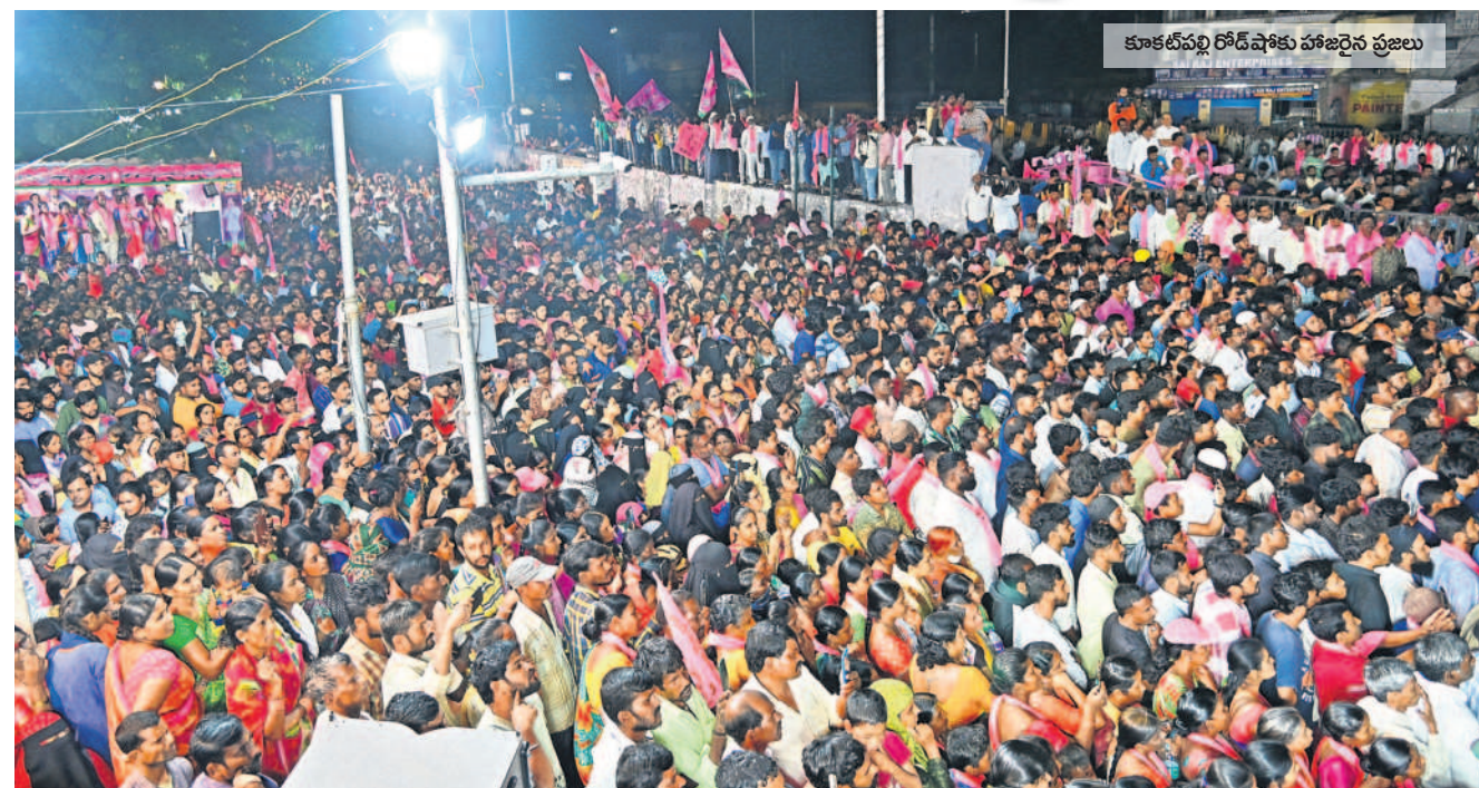
కూకట్‌పల్లి రోడ్‌షోకు హాజరైన ప్రజలు