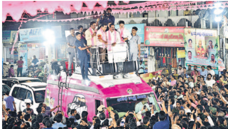
రోడ్‌షోకు తరలివచ్చిన ప్రజలు