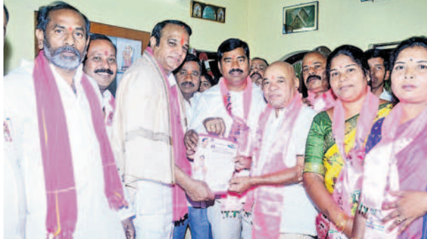
చంపాపేట డివిజన్ లో ప్రచారం నిర్వహిస్తున్న బీఆర్ఎస్ శ్రేణులు