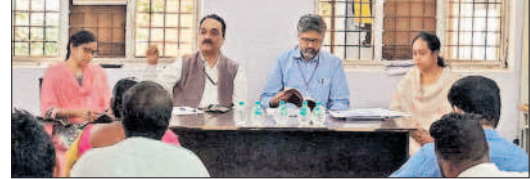
ఆసిఫ్ నగర్ లో అభ్యర్థులకు సూచనలు చేస్తున్న అధికారులు