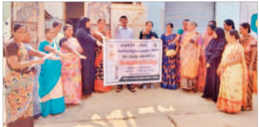
పట్టణంలో స్వీప్ ఓటరుపై ప్రతిజ్ఞ చేయిస్తున్న అధికారులు