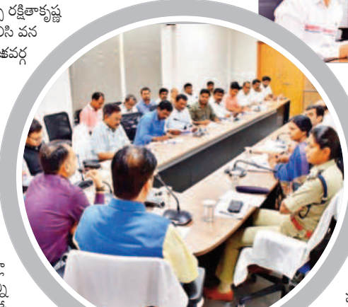
ఎన్నికల్లో పోటీ చేసే అభ్యర్థులతో వీడియో కాన్ఫరెన్స్ లో నిర్వహించిన సమీక్షకు హాజరైన అధికారులు