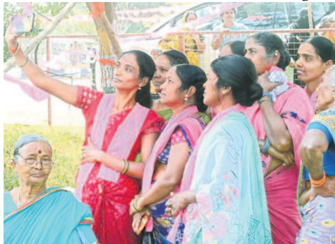
సభలో సెర్వీ తీసుకుంటున్న మహిళలు