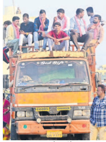
వాహనంపై కూర్చొని సీఎం కేసీఆర్ ప్రసంగం వింటున్న యువకులు