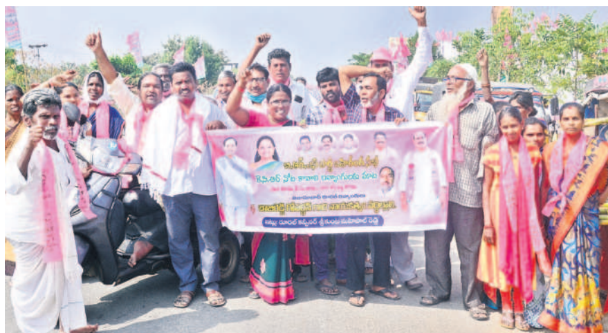
సారుకే మా మద్దతు.. ప్రజా శీర్షాద సభకు తరలివస్తున్న దివ్యాంగులు