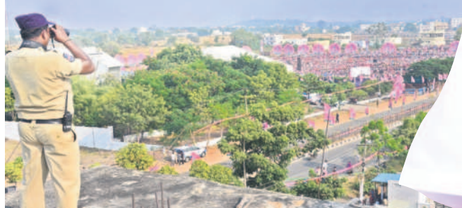
పోలీసుల నిఘా : సభా ప్రాంగణం, పరిసరాలను పరిశీలిస్తున్న పోలీసు సిబ్బంది