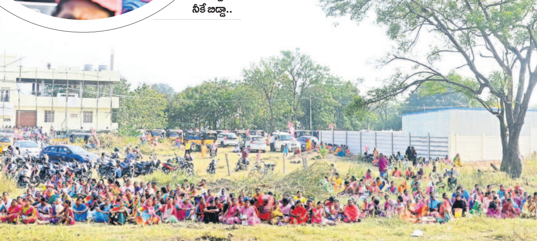
చెట్టు నీడలో కూర్చొని సీఎం కేసీఆర్ ప్రసంగాన్ని ఆసక్తిగా వింటున్న మహిళలు