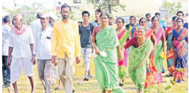
సభకు తరలివస్తున్న జనం