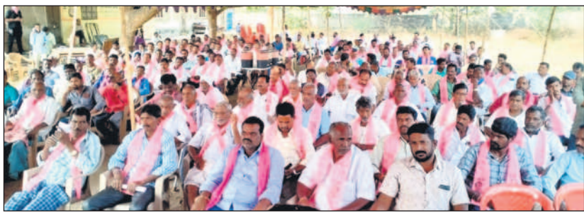
సమావేశానికి హాజరైన గౌడ కులస్తులు

తెలంగాణ ప్రభుత్వం కులవ్యత్యలను కాపాడుతూ ప్రోత్సహిస్తున్నదన్నారు. మెట్ట ప్రాంతమైన హుస్సాబాద్ నియోజకవర్గానికి గౌడవారి జలాలను తీసుకు