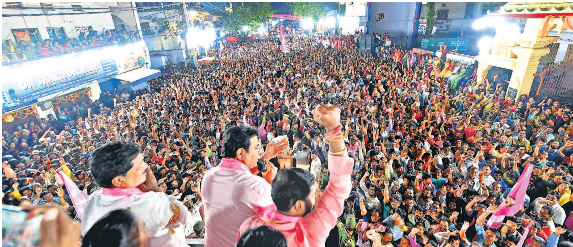
గురువారం హైదరాబాద్ నగరంలోని కూకట్‌పల్లి హాసింగ్ బోర్డు కాలనీ టెంపుల్ బస్టాప్ వద్ద నిర్వహించిన రోడ్ షోలో మాట్లాడుతున్న బీఆర్ఎస్ వర్కర్ ప్రెసిడెంట్, మంత్రి శే తారకరామారావు. పెద్ద సంఖ్యలో హాజరైన ప్రజలు