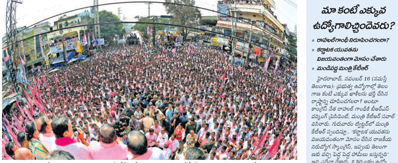
రంగారెడ్డి జిల్లా చేపెళ్ల నియోజకవర్గం మొయినిబాద్ రోడ్ షోలో మాట్లాడుతున్న మంత్రి కేటీఆర్. కార్యక్రమానికి పెద్ద సంఖ్యలో హాజరైన జనం