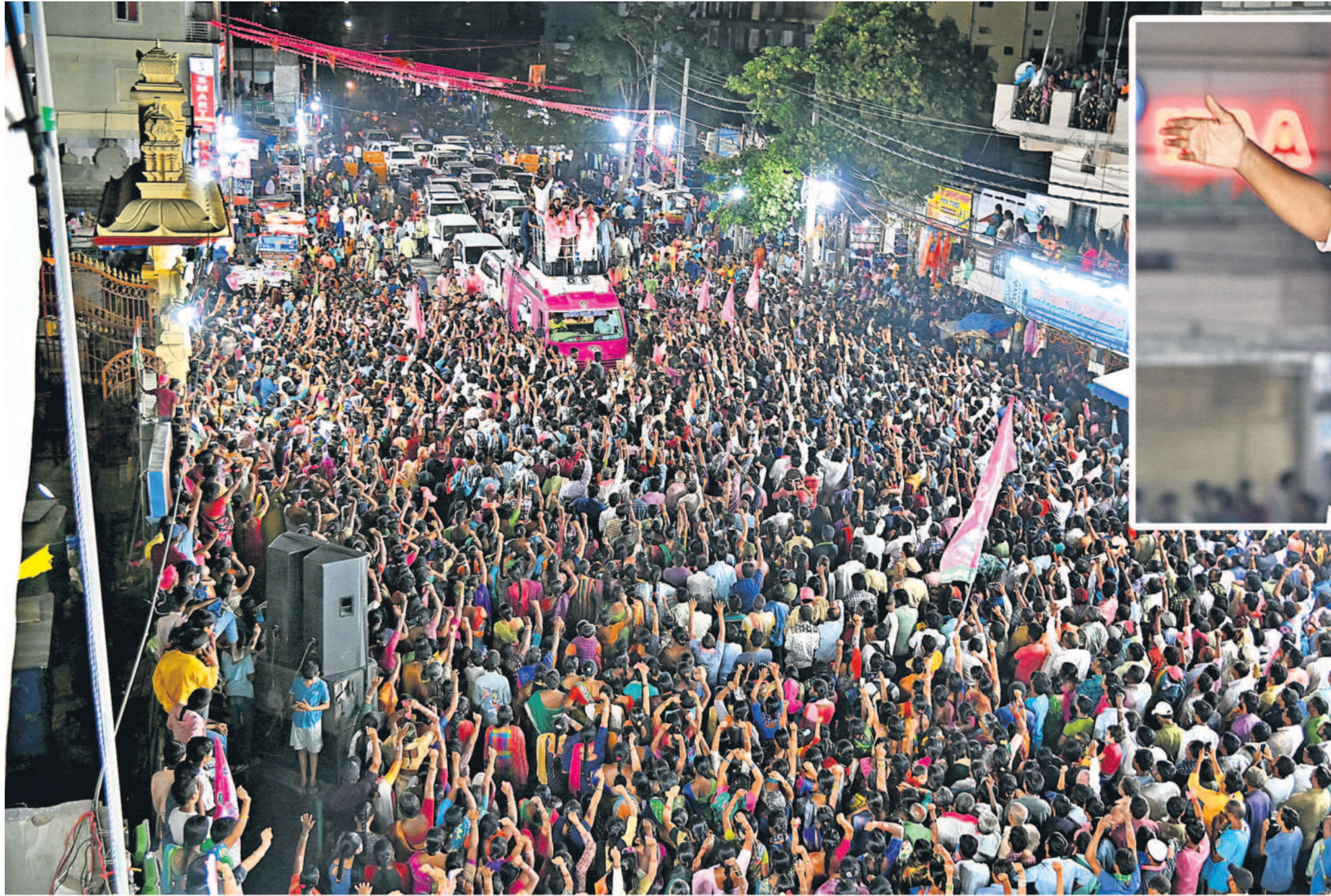
కూకట్‌పల్లి రోడ్‌షోలో ప్రసంగిస్తున్న మంత్రి కేటీఆర్, వక్రన్ ఎమ్మెల్యే మాధవరం కృష్ణారావు