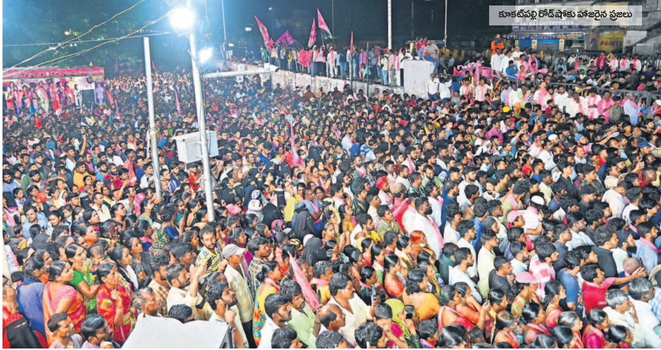
కూకట్‌పల్లి రోడ్‌షోకు హాజరైన ప్రజలు

కూకట్‌పల్లి, కుత్బుల్లాపూర్ నియోజకవర్గాల్లో మంత్రి కేటీఆర్ రోడ్ షో పనిచేసే ప్రభుత్వాన్ని మరోసారి ఆదరించాలని విజ్ఞప్తి