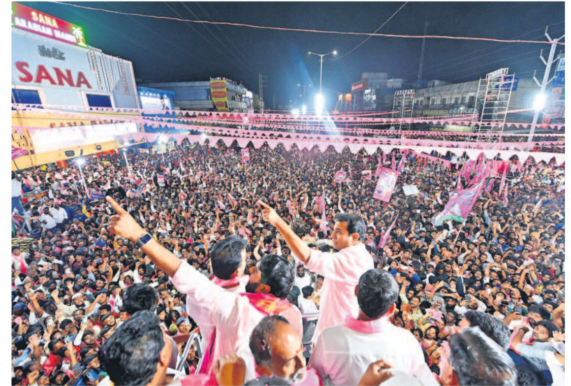
కుత్బుల్లాపూర్ రోడ్‌షోలో ప్రసంగిస్తున్న మంత్రి కేటీఆర్