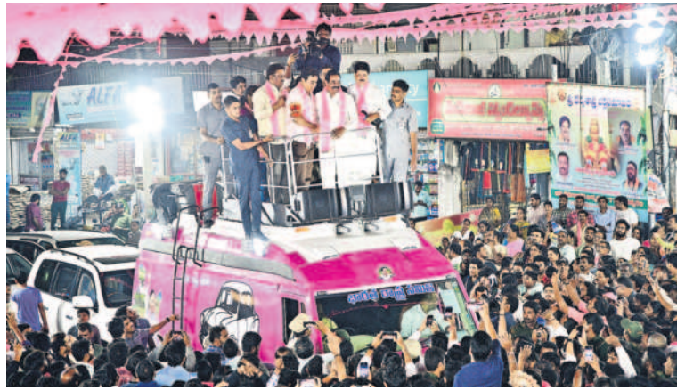
రోడ్‌షోకు తరలివచ్చిన ప్రజలు