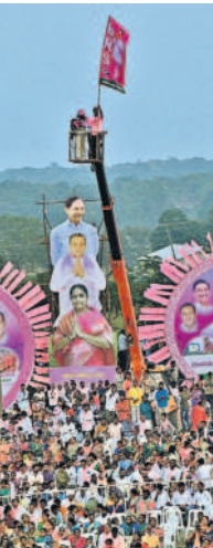
త్రేన్ ఎక్కిన అభిమానం