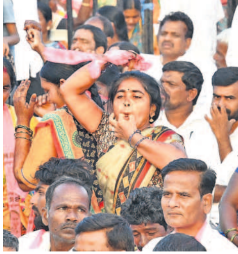
ఆనందంలో విజిల్ చేస్తున్న మహిళ

మెదక్ జిల్లా నర్సాపూర్లో జరిగిన ప్రజా ఆశీర్వాద సభా వేదికలో ప్రసంగిస్తున్న సీఎం కేసీఆర్, వేదికపై బీఆర్ఎస్ నాయకులు, ప్రజాప్రతినిధులు