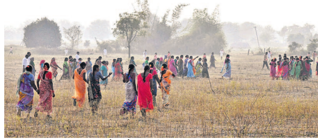
తమ అభిమాన నేత సీఎం కేసీఆర్ ను హనుమంతుడు చంట పొలాల గుండా వస్తున్న ప్రజలు