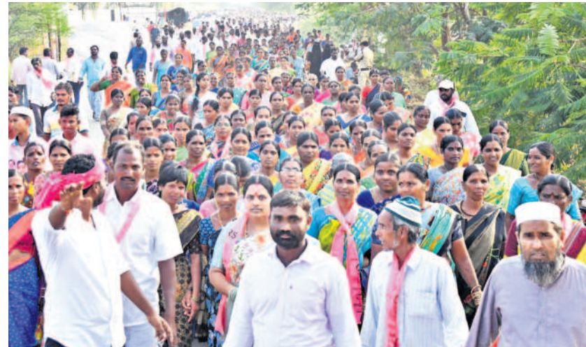
తండ్రిపంపడాలుగా సభకు తరలివస్తున్న జనం