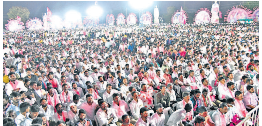
నర్సాపూర్ సభకు హాజరైన జనంలో ఓ భాగం

శివ్వంపేట, నవంబర్ 16: సాధారణ ఎన్నికల ప్రచారంలో భాగంగా మెదక్ జిల్లా నర్సాపూర్ నియోజకవర్గ బీఆర్ఎస్ అభ్యర్థి వాకిటి సునీతాలక్ష్మారెడ్డి గెలుపు కోసం సీఎం కేసీఆర్ గురువారం నిర్వహించిన ప్రజా ఆశీర్వాద సభ గ్రాండ్ సక్సెస్ అయ్యింది. నర్సాపూర్ పట్టణంలోని వెల్లూర్ రోడ్డు మార్గంలో ప్రజా ఆశీర్వాద సభ నిర్వహించారు. ఈ సభకు నియోజకవర్గంలోని నర్సాపూర్, శివ్వంపేట, కొడిపల్లి, వెల్లూర్, హత్తూర్, చిలిపిచెడ, మాసాయిపేట, కొల్వారం మండలాల