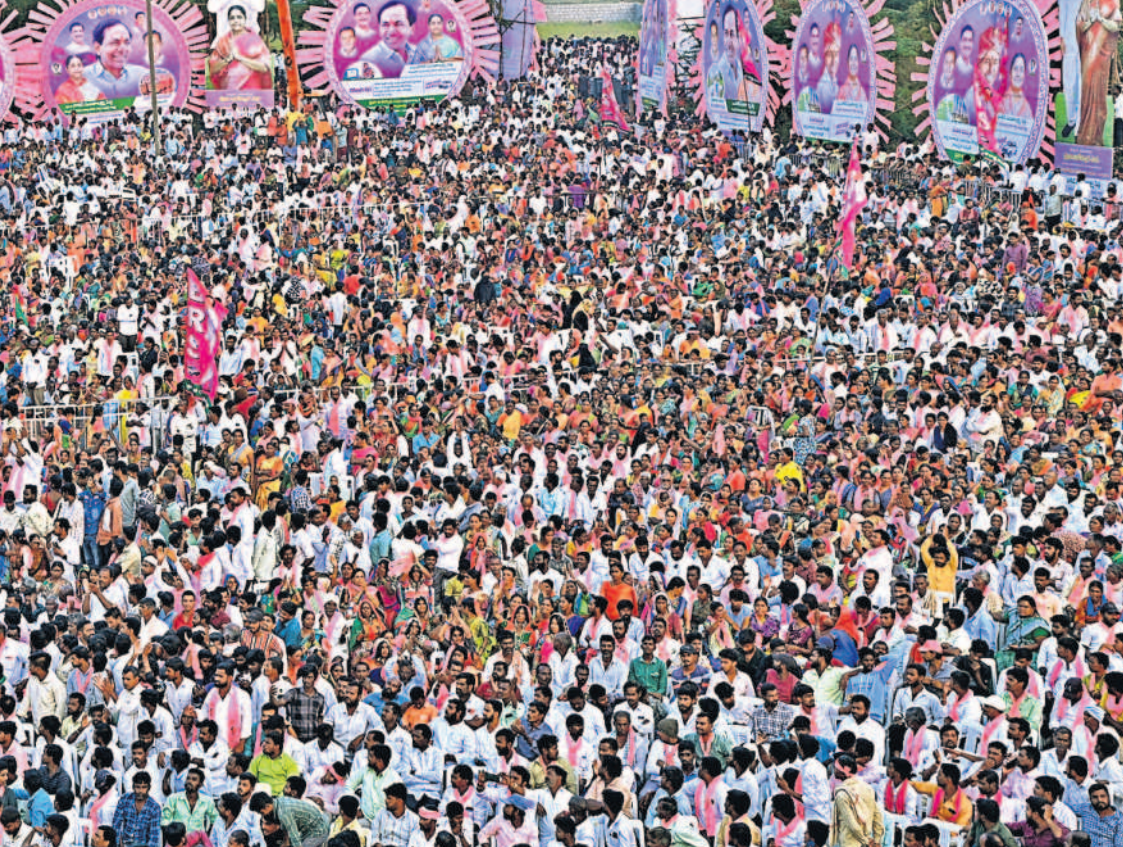
నర్సాపూర్ ప్రజా ఆశీర్వాద సభకు హాజరైన జనం