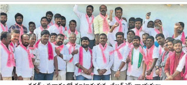
వర్ధల్ : ప్రచారంలో మాట్లాడుతున్న బీఆర్ఎస్ నాయకులు