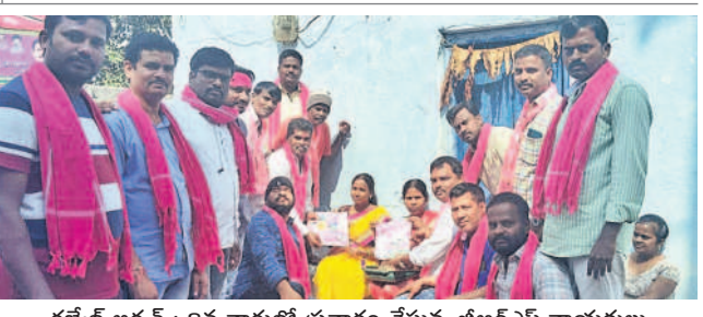
గజ్వేల్ అర్చన్ : 8వ వార్డులో ప్రచారం చేస్తున్న బీఆర్ఎస్ నాయకులు