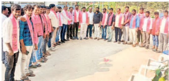
బీఆర్ఎస్లో చేరిన శేరిలింగంపల్లి కాంగ్రెస్ యువ నాయకులు