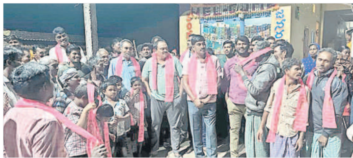
భీమిని: మద్దతు తెలుపుతున్న గ్రామస్థులు