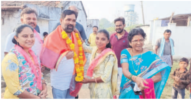
తాండూర్: బర్లగూడెంలో ఎమ్మెల్యే దుర్గం చిన్నయ్యకు పూలమాల వేసి స్వాగతం పలుకుతున్న మహిళ