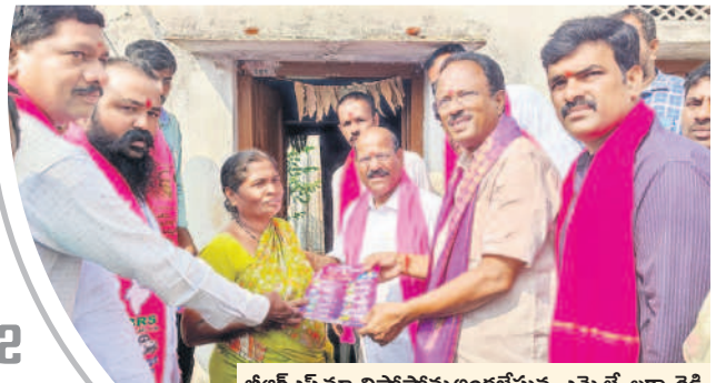
బీఆర్ఎస్ మ్యూనిసిపాలిటీను అందజేస్తున్న ఎమ్మెల్యే లక్ష్మారెడ్డి