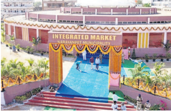
నారాయణపేట జిల్లా కేంద్రంలో నిర్మించిన ఇంటిగ్రేటెడ్ మార్కెట్