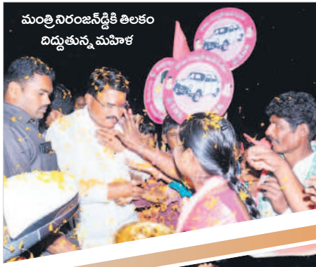
మంత్రి నిరంజన్ రెడ్డికి తిలకం దిద్దుతున్న మహిళ