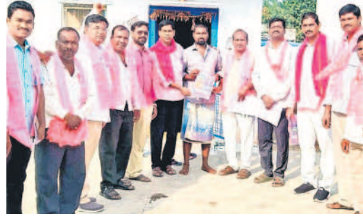
గట్టుప్పల్లో ప్రచారం చేస్తున్న బీఆర్ఎస్ నాయకులు