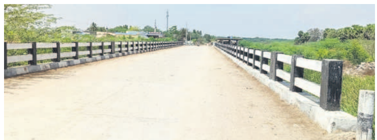
పన్నూరు వాగుపై నిర్మించిన బ్రిడ్జి