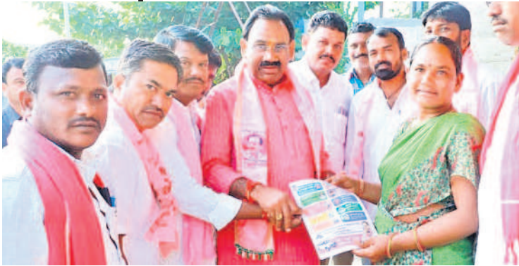
మునుగోడులో మహిళా కరపత్రాలు అందించి ఓటు అభ్యర్థిస్తున్న ఎమ్మెల్యే కూసుకుంట్ల ప్రభాకర్ రెడ్డి