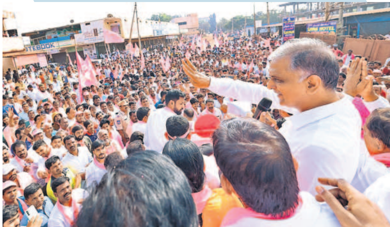
కోహార్ లోని పోలీస్ ఠాణెంలో బీఆర్ఎస్ కార్యక్రమం

కర్ణాటకలో కాంగ్రెస్ ఐదు గ్యారంటీలు ఐదు నెలలైనా అమలు కావడం లేదు..