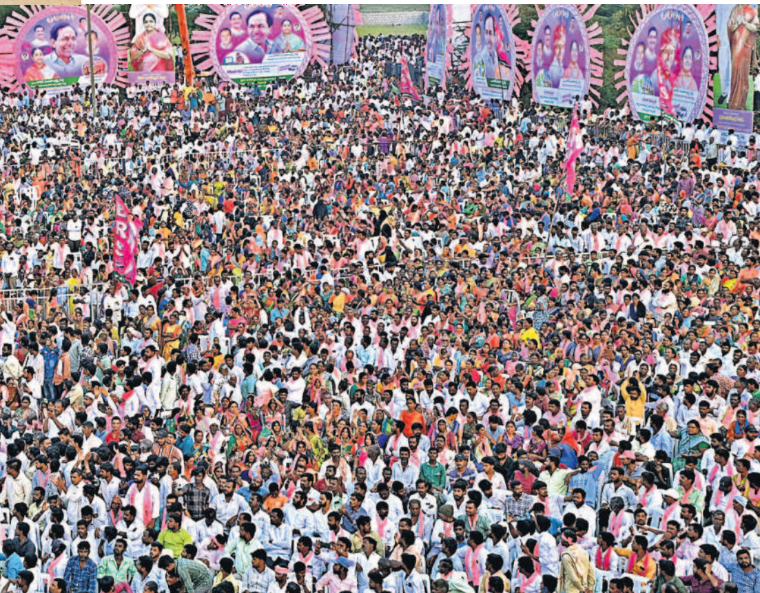
నర్సాపూర్ ప్రజా ఆశీర్వాద సభకు హాజరైన జనం