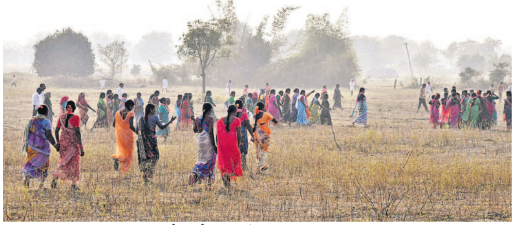
తమ అభిమాన నేత సీఎం కేసీఆర్ ను హనుమంతు చంట పాలాల గుండా వస్తున్న ప్రజలు