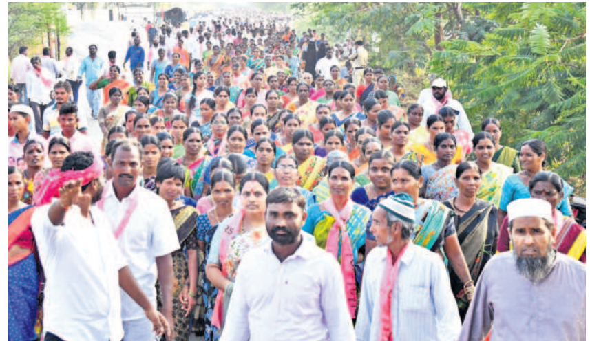
తండ్రిపంతులుగా సభకు తరలివస్తున్న జనం