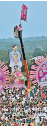
త్రేన్ ఎక్కిన అభిమానం