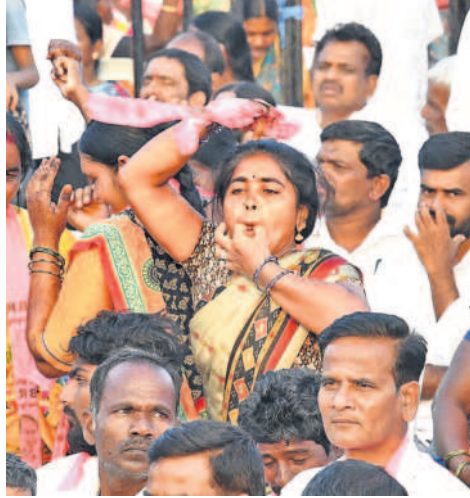
ఆనందంలో విజిల్ చేస్తున్న మహిళ

మెడక్ జిల్లా నర్సాపూర్లో జరిగిన ప్రజా ఆశీర్వాద సభా వేదికలో ప్రసంగిస్తున్న సీఎం కేసీఆర్, వేదికపై బీఆర్ఎస్ నాయకులు, ప్రజాప్రతినిధులు