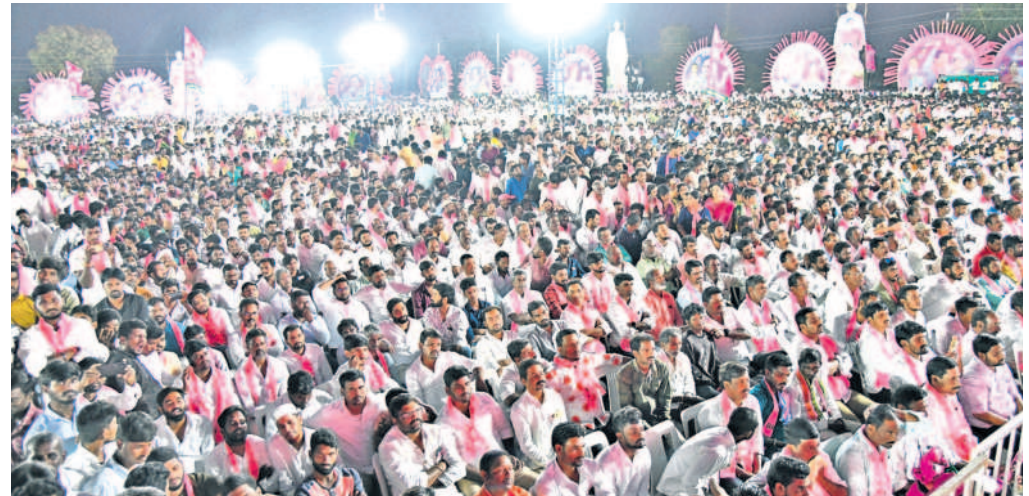
నర్సాపూర్ సభకు హాజరైన జనంలో ఓ భాగం