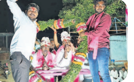
కంగ్లి : ఎమ్మెల్యే భూపాల్రెడ్డి, మాజీ ఎమ్మెల్యే విజయపాల్రెడ్డిలకు గజమాలతో సత్కరిస్తున్న కార్యకర్తలు