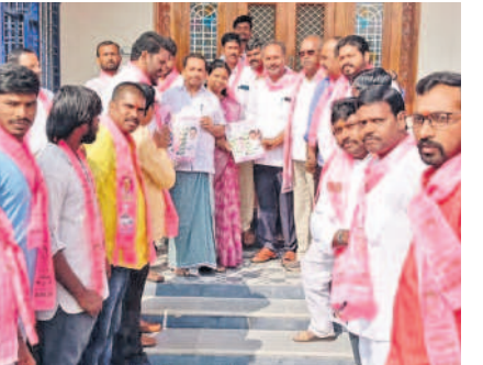
అందోల్ : జోగిపేటలో ఇంటింటి ప్రచారం నిర్వహిస్తున్న బీఆర్ఎస్ నాయకులు