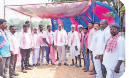
కల్లేర్ : ఎమ్మెల్యే సమక్షంలో బీఆర్ఎస్ లో చేరిన కాంగ్రెస్ నాయకులు