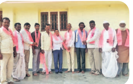
సిర్గాపూర్ : సంగం గ్రామంలో బీఆర్ఎస్ లో చేరుతున్న బీజేపీ నాయకులు