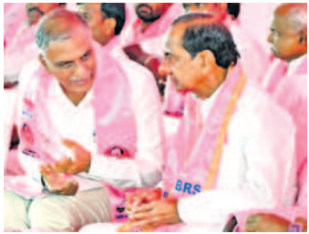
సభలో సీఎం కేసీఆర్ తో మంత్రి హరీశ్ రావు ముచ్చటలు..