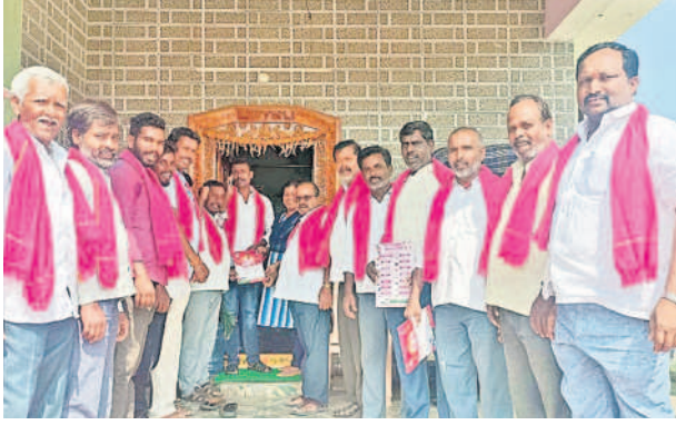
దుబ్బాక పట్టణంలో ఇంటింటి ప్రచారం చేస్తున్న ముదిరాజ్ కుల సంఘం నాయకులు, బీఆర్ఎస్ నాయకులు