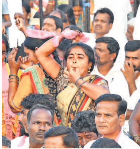
ఆనందంలో విజిల్ చేస్తున్న మహిళ

మెడక్ జిల్లా నర్సాపూర్లో జరిగిన ప్రజా ఆశీర్వాద సభా వేదికలో ప్రసంగిస్తున్న సీఎం కేసీఆర్, వేదికపై బీఆర్ఎస్ నాయకులు, ప్రజాప్రతినిధులు