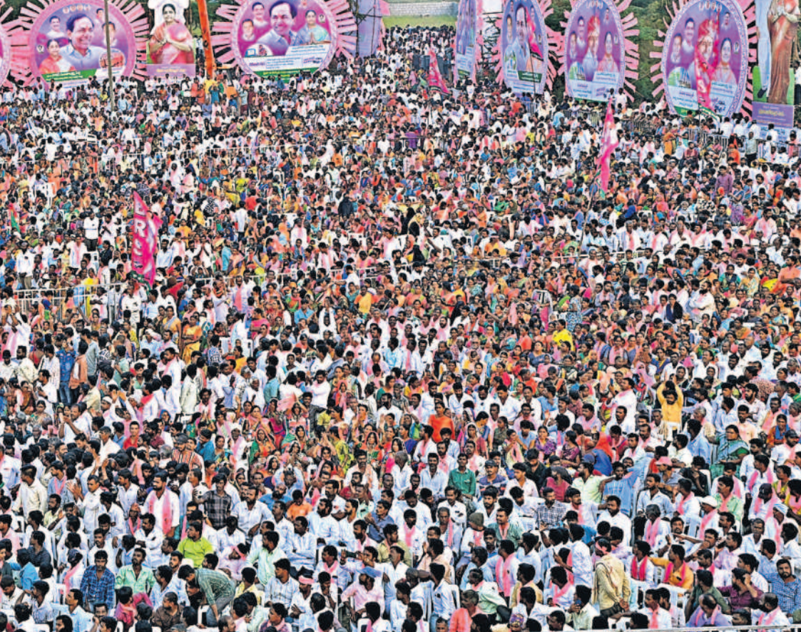
నర్సాపూర్ ప్రజా ఆశీర్వాద సభకు హాజరైన జనం