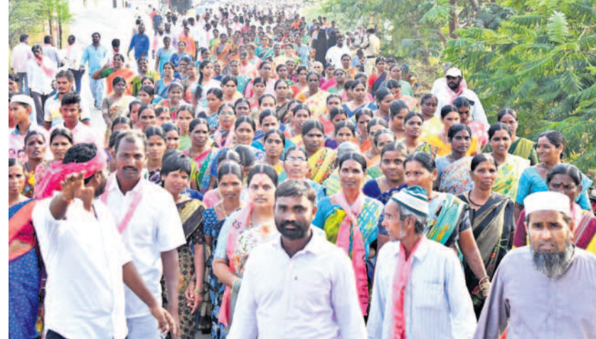
తండ్రిపంతులుగా సభకు తరలివస్తున్న జనం