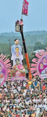
త్రేన్ ఎక్కిన అభిమానం