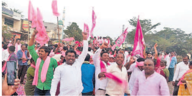
ర్యాలీగా వెళుతున్న బీఆర్ఎస్ నాయకులు, కార్యకర్తలు