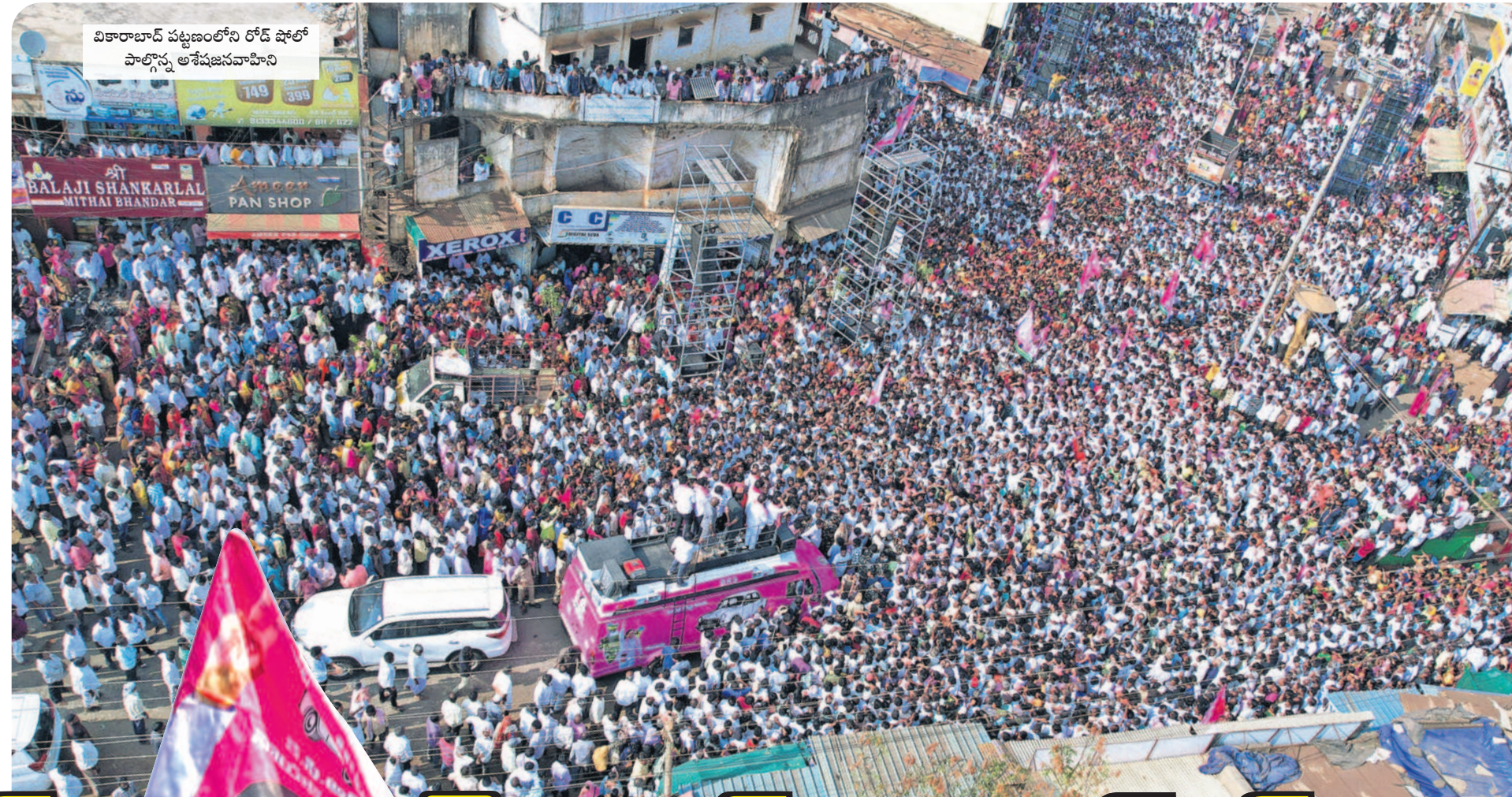
వికారాబాద్ పట్టణంలోని రోడ్ షోలో పాల్గొన్న అశేషజనవాహిని