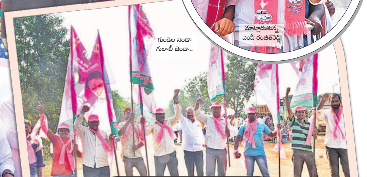
గుండెల నిండా గులాబీ జెండా..