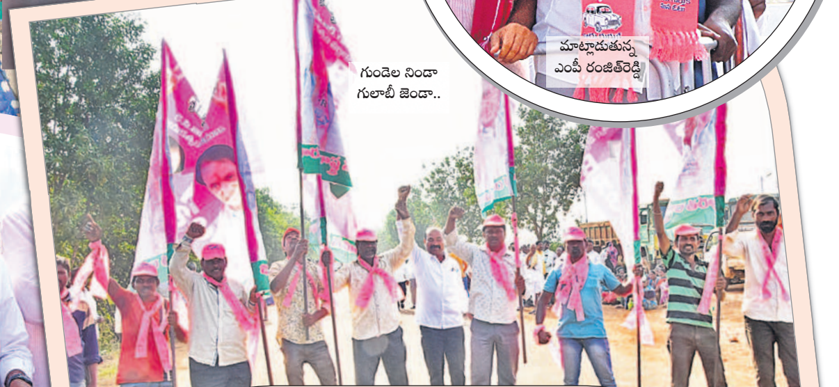
గుంజెల నిండా గులాబీ జెండా..