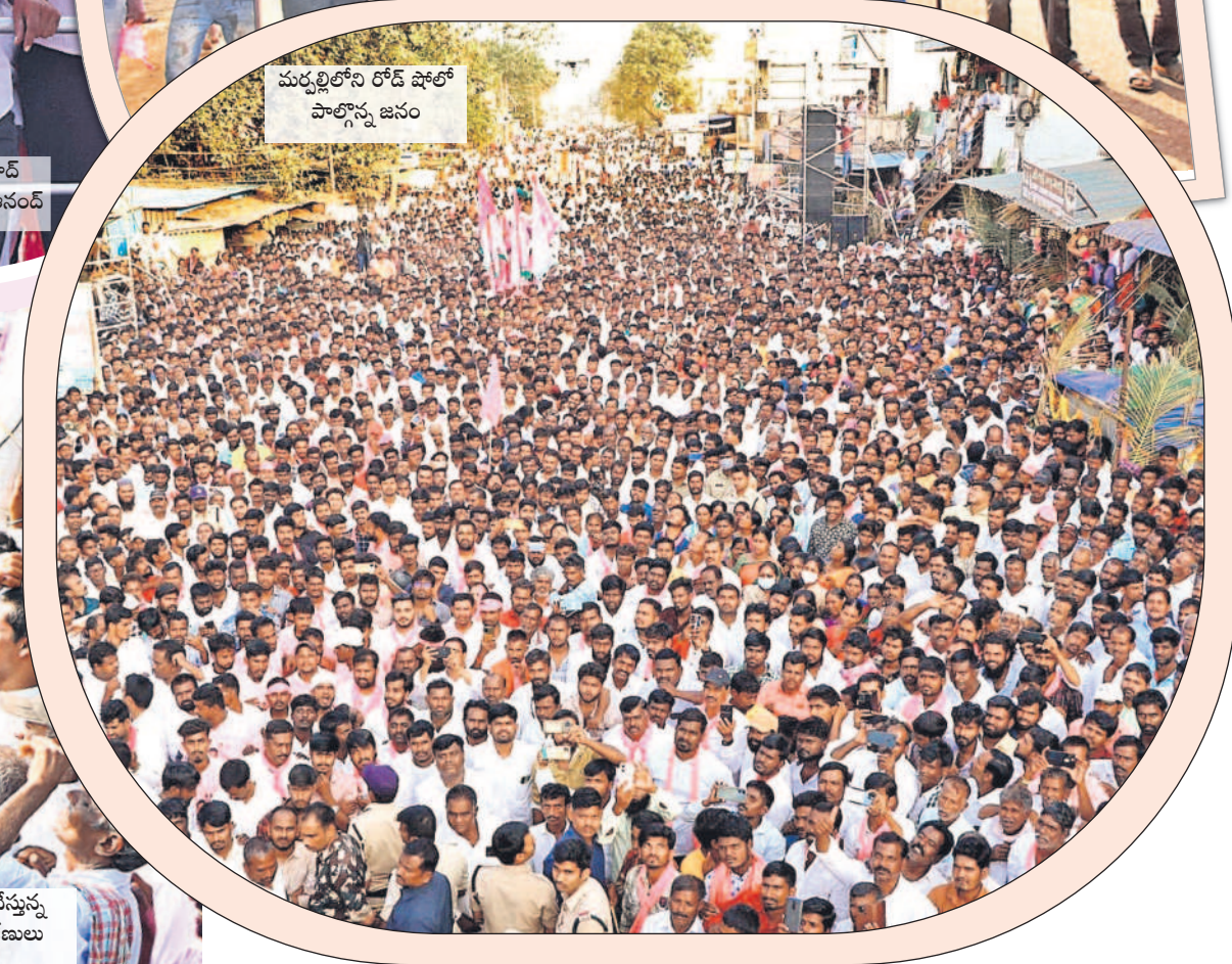
మర్నాటిలోని రోడ్ షోలో పాల్గొన్న జనం