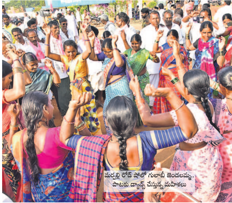
మర్నాటి రోడ్ షోలో గులాబీ జెండలమ్మ... పాటకు డ్యాన్స్ చేస్తున్న మహిళలు