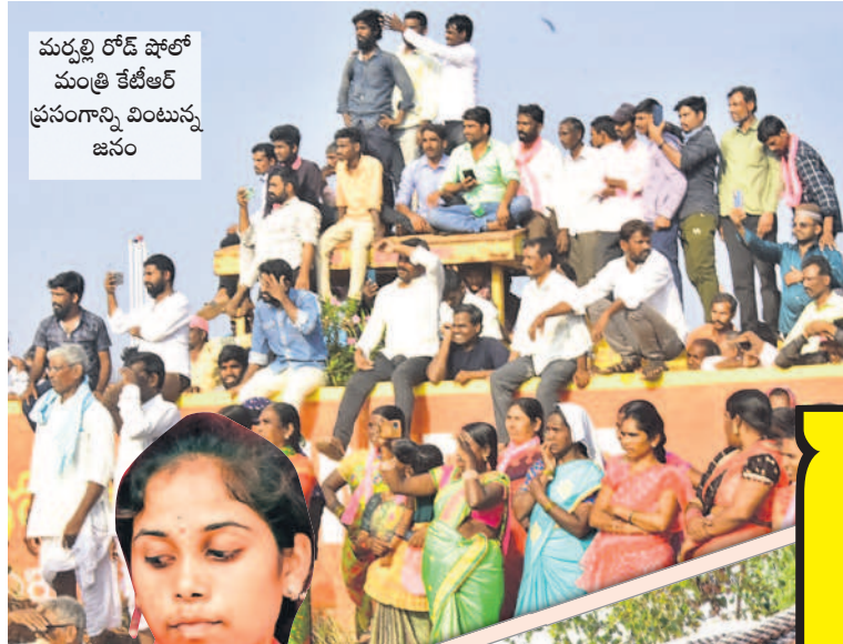
మర్నాటి రోడ్ షోలో మంత్రి కేటీఆర్ ప్రసంగాన్ని వింటున్న జనం