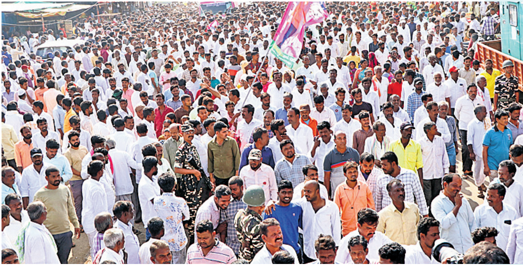
వికారాబాద్ : మంత్రి కేసీఆర్ రోడ్ షోకు తరలివస్తున్న ప్రజలు, బీఆర్ఎస్ శ్రేణులు