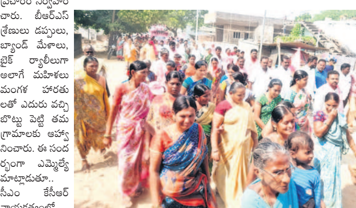
బిక్కుమళ్లలో ఎమ్మెల్యే కిశోర్ కుమార్ ప్రచారానికి హాజరైన బీఆర్ఎస్ శ్రేణులు, ప్రజలు

ప్రభుత్వం మాత్రమే మళ్లీ అధికారంలోకి రాబోతున్నట్లు చెప్పారు. తెలంగాణ ప్రజలను కడుపులో పెట్టుకుని కాపాడుకునే కేసీఆర్ కావాలి.. అబద్ధపు హామీలతో సున్నం పెట్టి కాంగ్రెస్, బీజేపీ కావాలి ప్రజలే ఆలోచించాలని విజ్ఞప్తి చేశారు. కాంగ్రెస్ కు అధికారం ఇస్తే 24 గంటల కరింటి ఇవ్వరని, రైతు బంధు బండ్ చేస్తారని విమర్శించారు. తుంగతుర్తి నియోజక వర్గాన్ని అన్ని రంగాల్లో అభివృద్ధి చేస్తున్న తనను ఆశీర్వాదించి గెలిపిస్తే మరింత అభివృద్ధి చేస్తానని హామీ ఇచ్చారు. సీఎం కేసీఆర్ సార