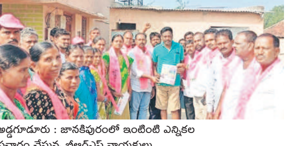
అడ్డగూడూరు : జానకిపురంలో ఇంటింటి ఎన్నికల ప్రచారం చేస్తున్న బీఆర్ఎస్ నాయకులు