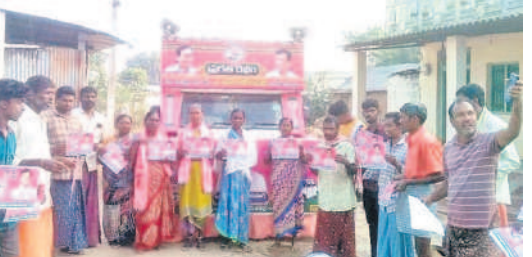
నాగారం : మామిడిపల్లిలో ప్రచారం చేస్తున్న సర్పంచ్ పుష్పమాల