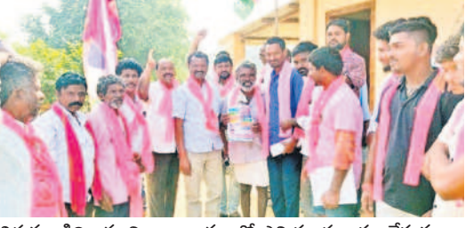
తిరుమలగిరి : మామిడిపల్లి గ్రామంలో ఎన్నికల ప్రచారం చేస్తున్న బీఆర్ఎస్ నాయకులు