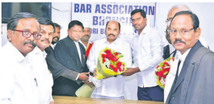
భువనగిరి కోర్టు ప్రిన్సిపల్ డిస్ట్రిక్ట్ అండ్ సెషన్ జడ్జి ఎ.జయరాజుకు పుష్పగుచ్ఛం అందిస్తున్న బార్ అసోసియేషన్ సభ్యులు