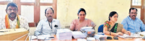
వలిగొండలో ఓటరు స్లిప్ల పంపిణీపై అవగాహన కల్పిస్తున్న అధికారులు