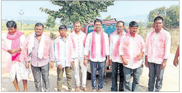
పెంబ : సభకు తరలివెళ్తున్న బీఆర్ఎస్ నాయకులు