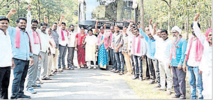
ఉట్టూర్ : నినాదాలు చేస్తున్న నాయకులు