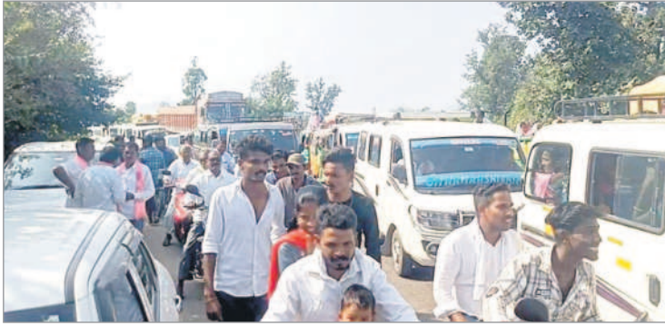
దస్తూరాబాద్ : బహిరంగ సభకు తరలివెళ్తున్న నాయకులు, ప్రజలు