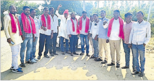
ఖానాపూర్ రూరల్ : సభకు బయలు దేరుతున్న ముస్సాపూర్ బీఆర్ఎస్ నాయకులు