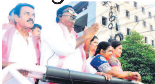
రోడ్ షా అభివాదం చేస్తున్న మంత్రి పువ్వాడ