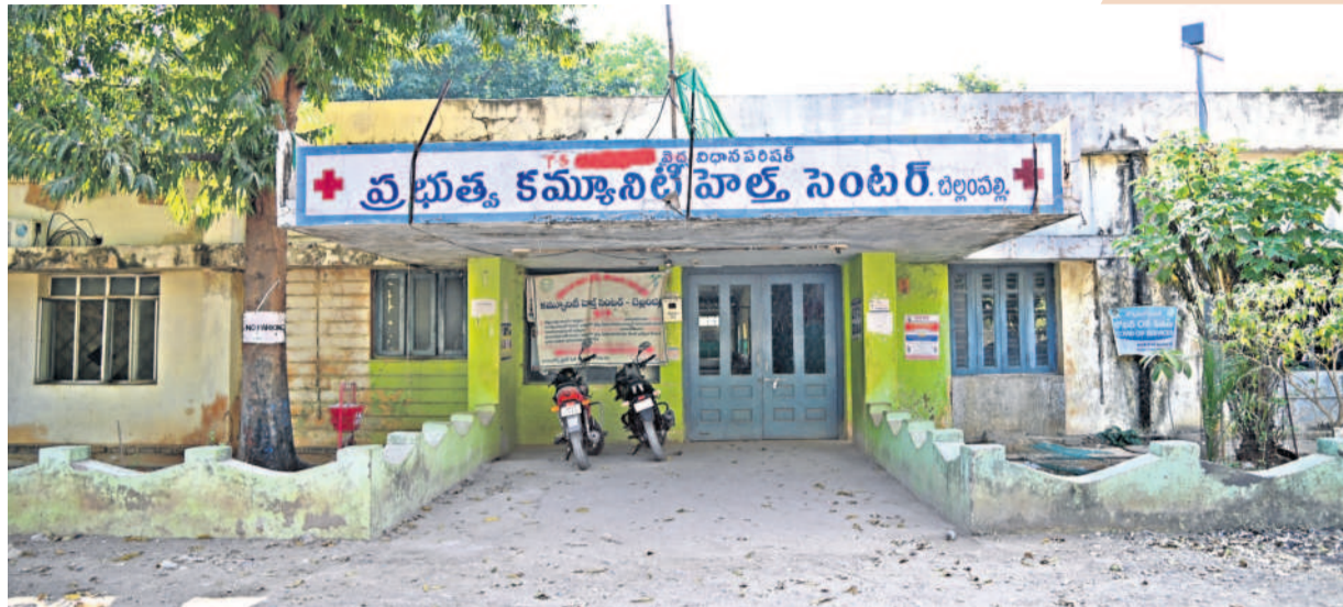
జనం అవసరాలకు తగ్గట్టు దవాఖానల ఏర్పాటు అన్నది పాత పాలకుల దిక్కునలేనే లేదు. ఒకప్పుడు ఉమ్మడి ఆదిలాబాద్ జిల్లా బెల్లంపల్లి ప్రభుత్వ కమ్యూనిటీ హెల్త్ సెంటర్ కు వెళ్ళాలంటేనే రోగులు భయపడేవారు. బెల్లంపల్లి నియోజకవర్గం ప్రజలు సహజ వక్రనే ఉన్న రెవెన్యూ, తిర్యాణి మండలాల నుంచి వచ్చే వందల మందికి ఈ ఆసుపత్రి దిక్కు. కానీ ఉన్నది కేవలం 30 పడకలే. దీంతో మిగతా పేషెంట్లకే కాదు, ప్రసవాలంటే వాటికి బెడ్లు సరిపోని పరిస్థితి అక్కడ.