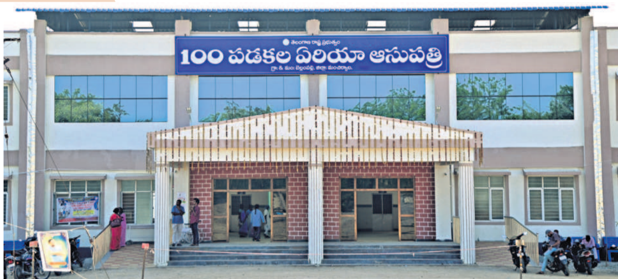
ప్రజారోగ్యానికి పెద్దపీట వేసే బీఆర్ఎస్ సర్కారు అధికారంలోకి వచ్చిన తర్వాత బెల్లంపల్లి 30 పడకల ప్రభుత్వ కమ్యూనిటీ హెల్త్ సెంటర్ స్థానంలో 100 పడకల ఏరియా ఆసుపత్రి వచ్చింది. రూ.16 కోట్లతో అత్యాధునిక వసతులు కల్పించారు. గ్రెనీక్, డిడియాలజీ, డెంటల్, అయర్ కేర్లతో పాటు మీడియాట్రిక్, సర్జరీ సేవలు అందు బాటులోకి వచ్చాయి. డయాలసిస్ సెంటర్ కూడా ప్రారంభమైంది. ఆపరేషన్ థియేటర్ల సంఖ్యనూ పెంచారు. ఇప్పుడు జనం వైద్యం చేయించుకుంటున్నారు.