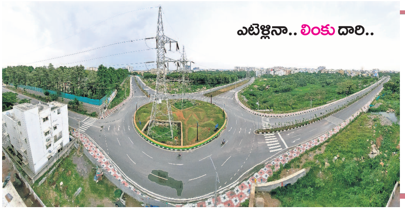
ఎట్టికైనా.. లింకు దారి..