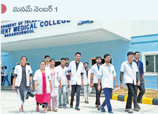
మనమే నెంబర్ 1

పథకం ప్రారంభం 2014 లక్షల మంది 55 లక్షల మంది